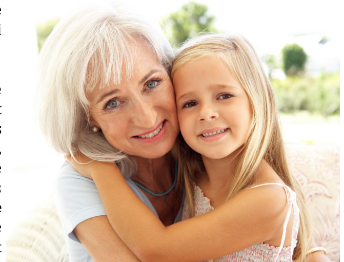
CARTaGENE pour la santé des Québécois